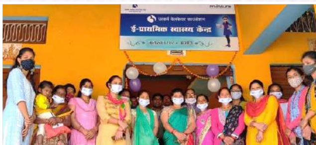
Launch of E-Clinic - Jalikhan, Almora, Uttarakhand