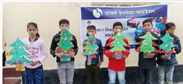
Christmas Day Celebration with Students under Learning Enhancement Program