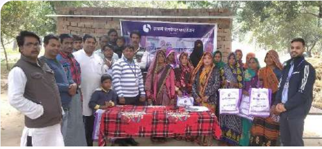
कारिगरों के बीच 'ओरिएंटेशन टूलकीट' बांटे गए