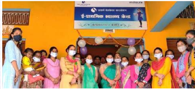
ई-क्लिनिक का शुभारंभ – जलीखान, अलमोदा, उत्तराखंड