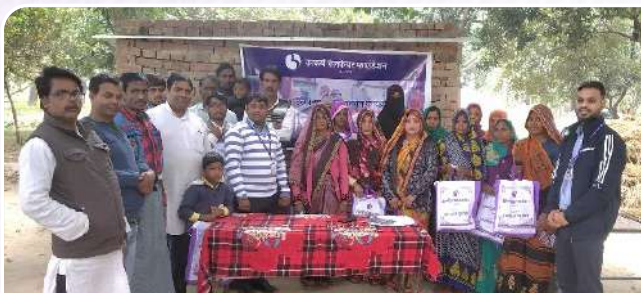
Orientation Toolkits distributed among Artisans