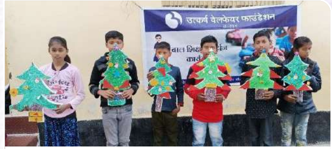
लर्निंग एन्हांसमेंट प्रोग्राम के तहत छात्रों के साथ क्रिसमस डे सेलिब्रेशन